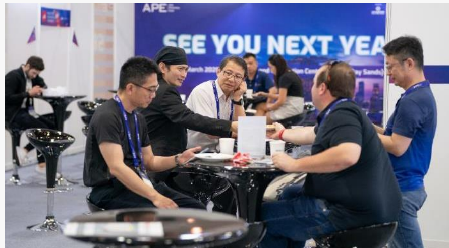
APE 2024 VIP 休息室 - 商贸配对